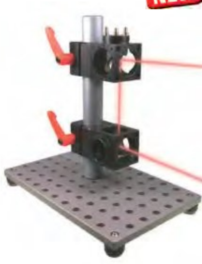
Exemplary application for the vertical adjustment set. The base plate is not included in the delivery.